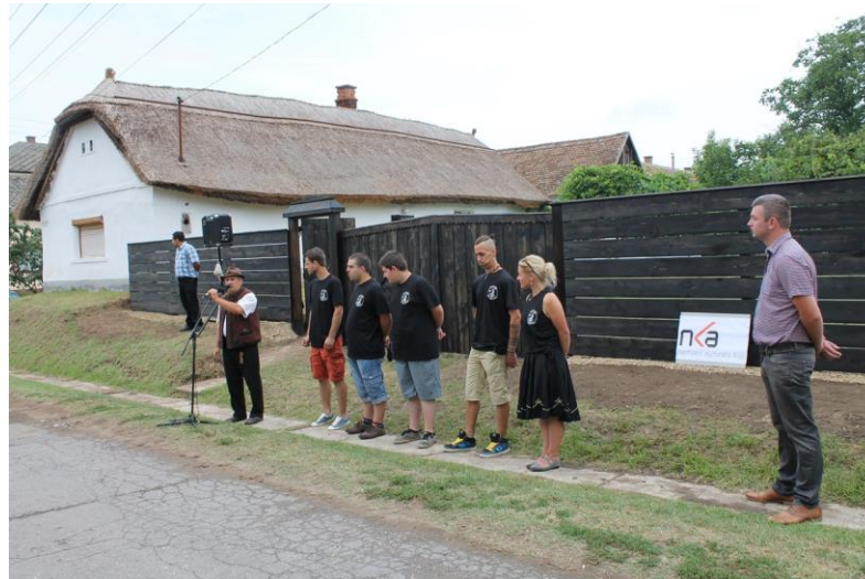
A tájház kapuja és kerítése az átadás napján