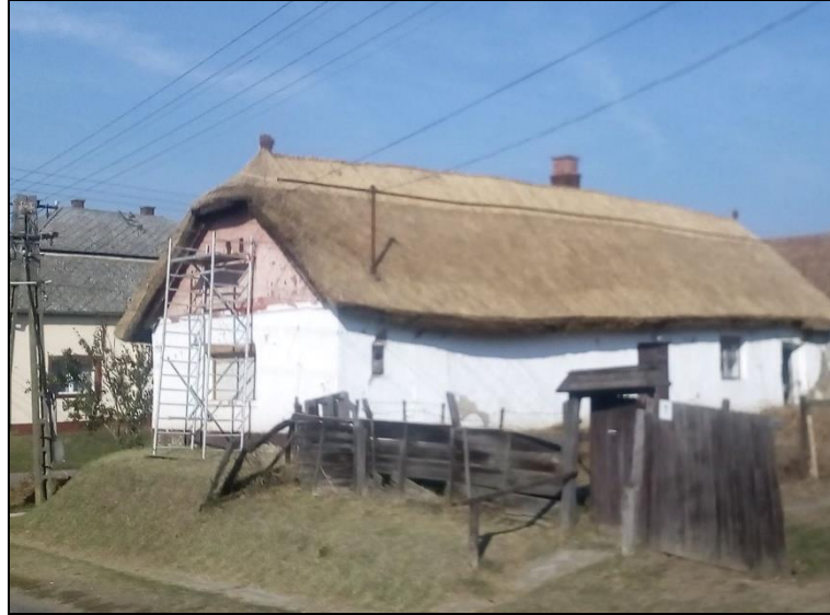
Csillagváros utcai tájház régi kapuja